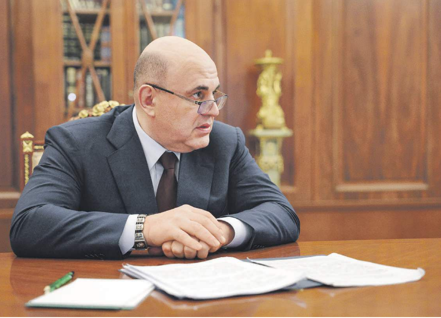
Михаил Мишустин был в этот день энергичен

Ну точно же! А теперь послушать бы начальника транспортного цеха!