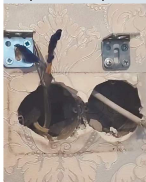
животных и под контролем видеокamеры захватили котенка.

Освобожденный пленник сразу поехал на ПМЖ к командиру экипажа.