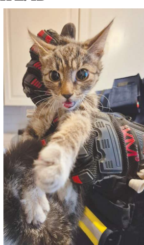
Котенка извлекли через эти отверстия.

Потом они обратились к соседям этажом ниже, но из их квартиры доступа через вентиляцию нет. По договоренности с заявителем специалисты увеличили ревизионное отверстие, опустили вниз петлю для ловли