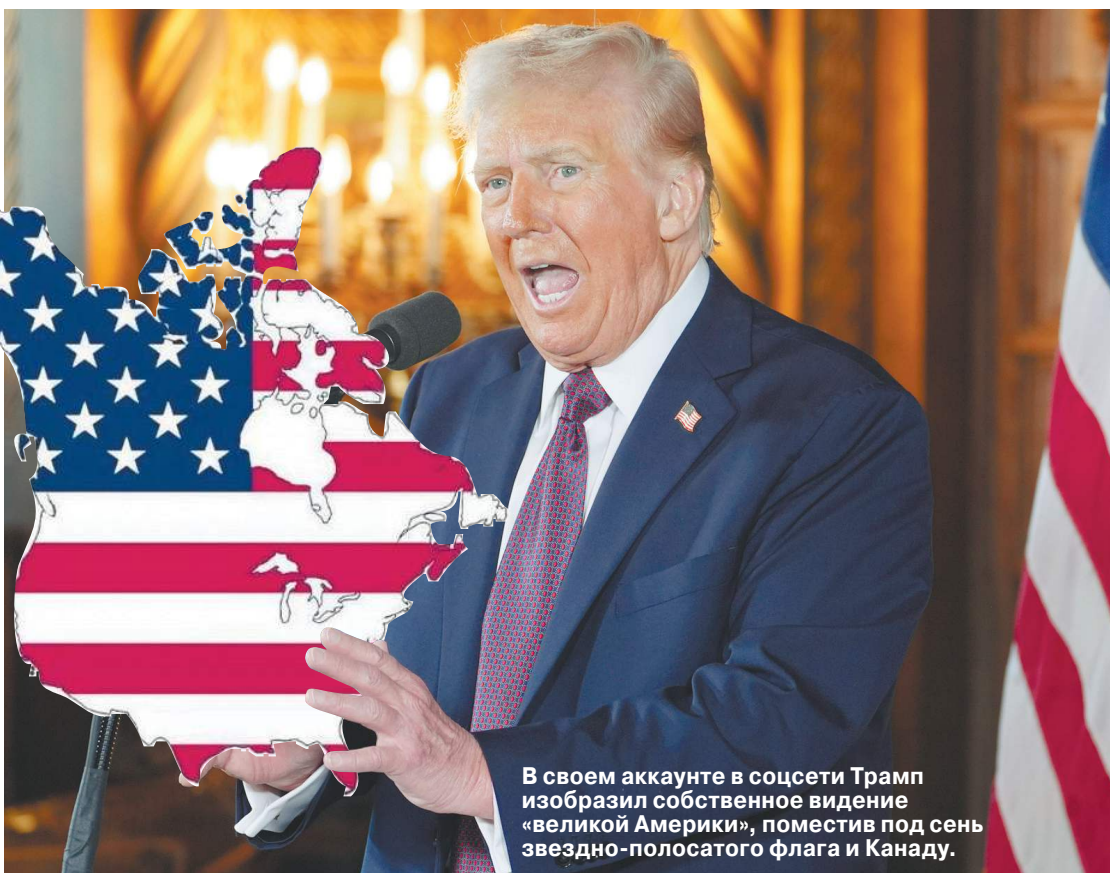
В своем аккаунте в соцсети Трамп изобразил собственное видение «великой Америки», поместив под сень звездно-полосатого флага и Канаду.