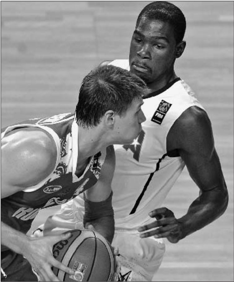
В 2010 году Андрей ВОРОНЦЕВИЧ и Кевин ДЮРАНТ были соперниками на чемпионате мира, а уже скоро могут стать партнерами в «Оклахома-Сити». Также на россиянина претендуют «Сан-Антонио», «Хьюстон», «Орlando» и «Портленд».