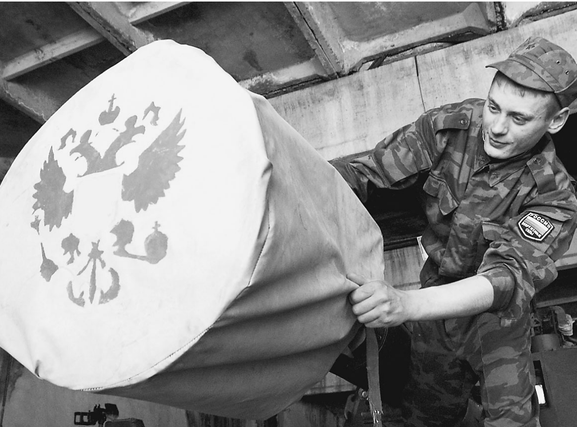
Российские военные на базе в АХАЛКАЛАКИ уже готовят технику к отправке

С понедельника у России больше нет военных баз в Грузии — с таким неожиданным результатом закончились в Москве внеплановые переговоры министров иностранных дел России и Грузии. В «Совместном соглашении», подписанном вчера Сергеем Лавровым и Саломе Зурабишвили, сказано: «РВБ (российские военные базы. — «Известия») Батуми и Ахалкалаки прекращают деятельность по предназначению и будут функционировать в режиме вывода с момента подписания данного Заявления». Таким образом Россия избавилась от одного из своих имперских мифов — на самом деле военные базы в Грузии давно не имели ни военного, ни политического значения. → стр. 2