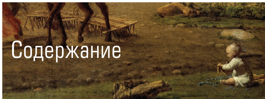
ОБЛОЖКА: АЛЕКСАНДРО ВЕНЕЦИАНОВ. НА ПАСШЕ. ВЕСНА