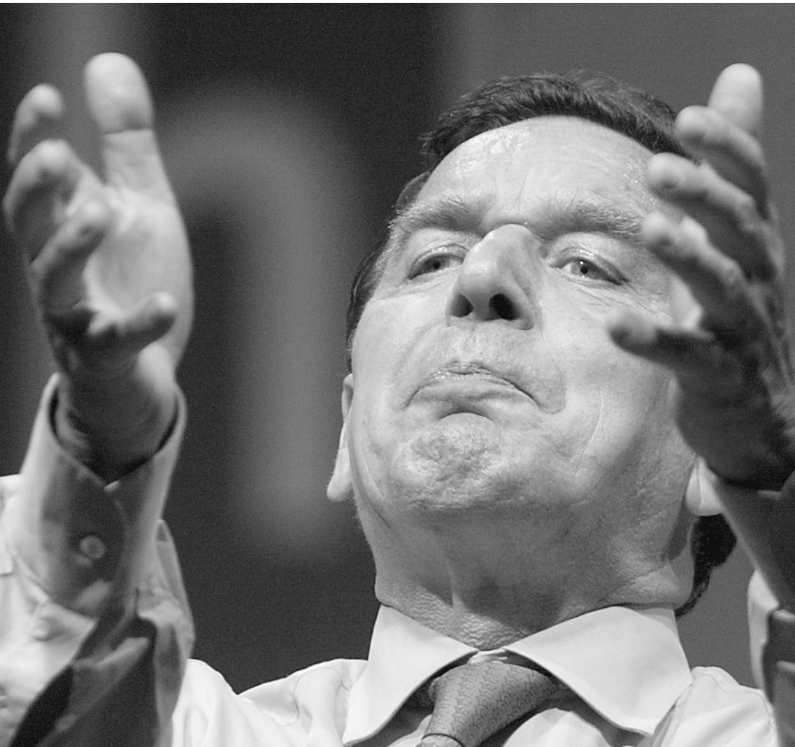
ГЕРХАРД ШРЕДЕР вручает свою судьбу в руки избирателей

Объявив внеочередные выборы, Герхард Шредер дал понять, что ему нужен от избирателей «кредит доверия» для продолжения начатых реформ. О каких именно преобразованиях идет речь? Главная из «реформ Шредера» — так называемая «Повестка дня 2010», предполагающая кардинальную перестройку рынка труда. Первые шаги по ее реализации вызвали протесты в обществе. Несмотря на все усилия правительства, безработица в стране продолжает расти, в то время как социальные льготы, которыми всегда так гордились немцы, сокращаются.