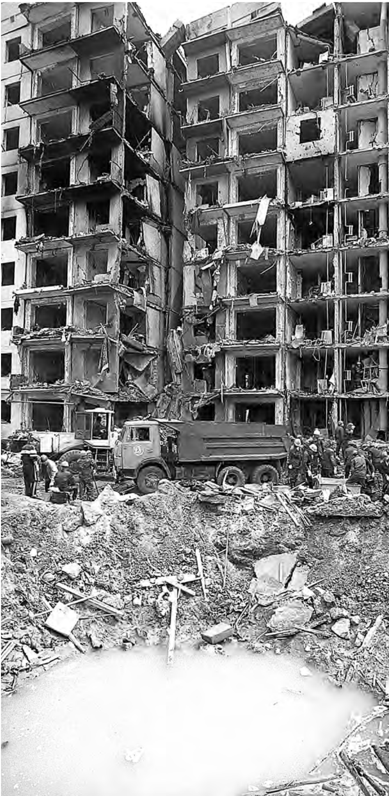
Взрыв жилого дома в Волгодонске 16 сентября 1999 года унес жизни 19 человек, 90 человек были госпитализированы. Взрывчатка находилась в грузовике, что стоял рядом со зданием. Целью террористов была массовая гибель людей и устрашение населения.

Терроризм существовал еще в начале прошлого века. Одним из первых террористов считается Степан Халтурин, устроивший взрыв в Зимнем дворце, чтобы убить императора Александра II. Каково «лицо» современного терроризма, на кого он нацелен?