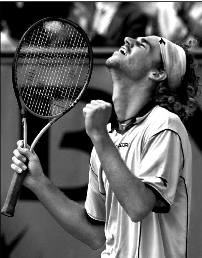
Вчера. Париж. Густаво КУЭРТЕН побеждает Евгения Кафельникова.