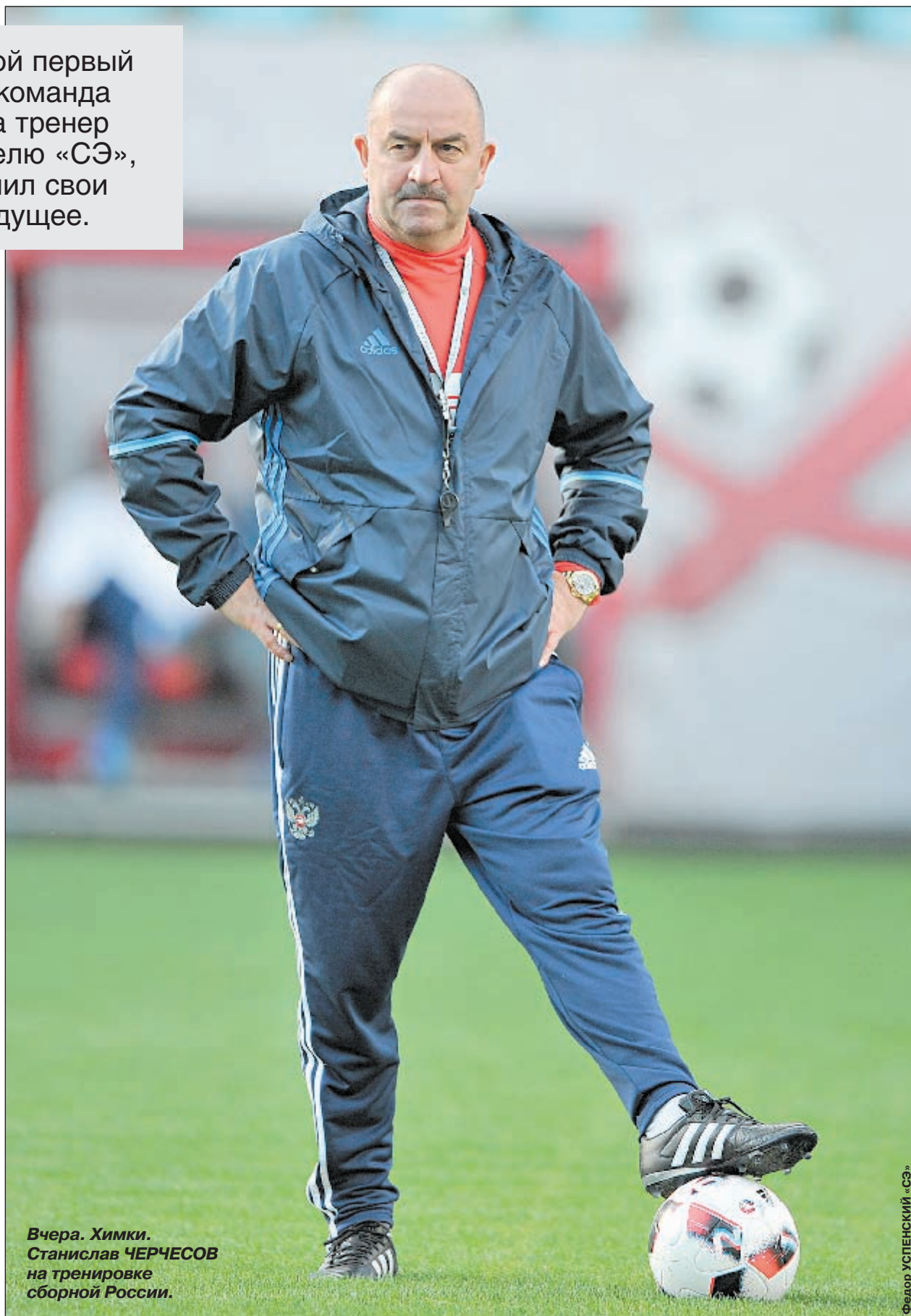
Вчера. Химки. Станислав ЧЕРЧЕСОВ на тренировке сборной России.

РОСГОССТРАХ - ЧЕМПИОНАТ РОССИИ. ПРЕМЬЕР-ЛИГА