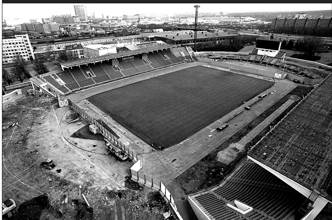
Так будет выглядеть стадион «Локомотив» в следующем году (макет), а так он выглядел вчера.

Но уже в следующем году проект должен превратиться в реальность