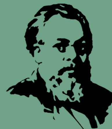
С. П. Боткин