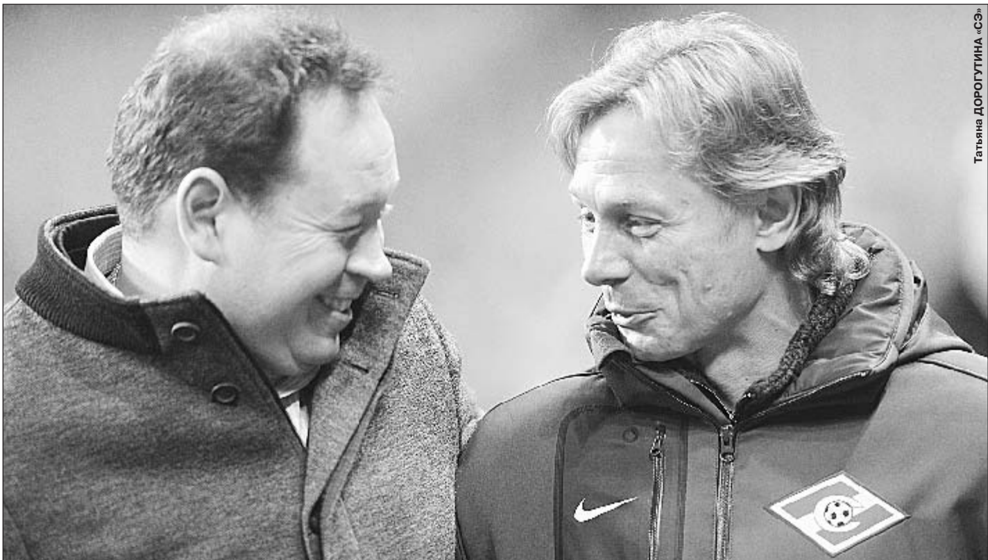
Леонид СЛУЦКИЙ и Валерий КАРПИН: завтра им будет не до улыбок.