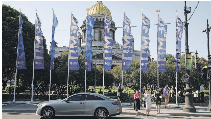
Евгений Рязанцев / ТАСС