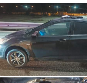
Оружие, которое нашли в машине.

При необычных обстоя- тельствах удалось следо- вателям подмосковного ГСУ СКР разоблачить мужчину, собравшегося совершить убийство бывшей жены. Неожиданно в раскрытии преступления помогла... схема организации про- езда на платных трассах Московской области!