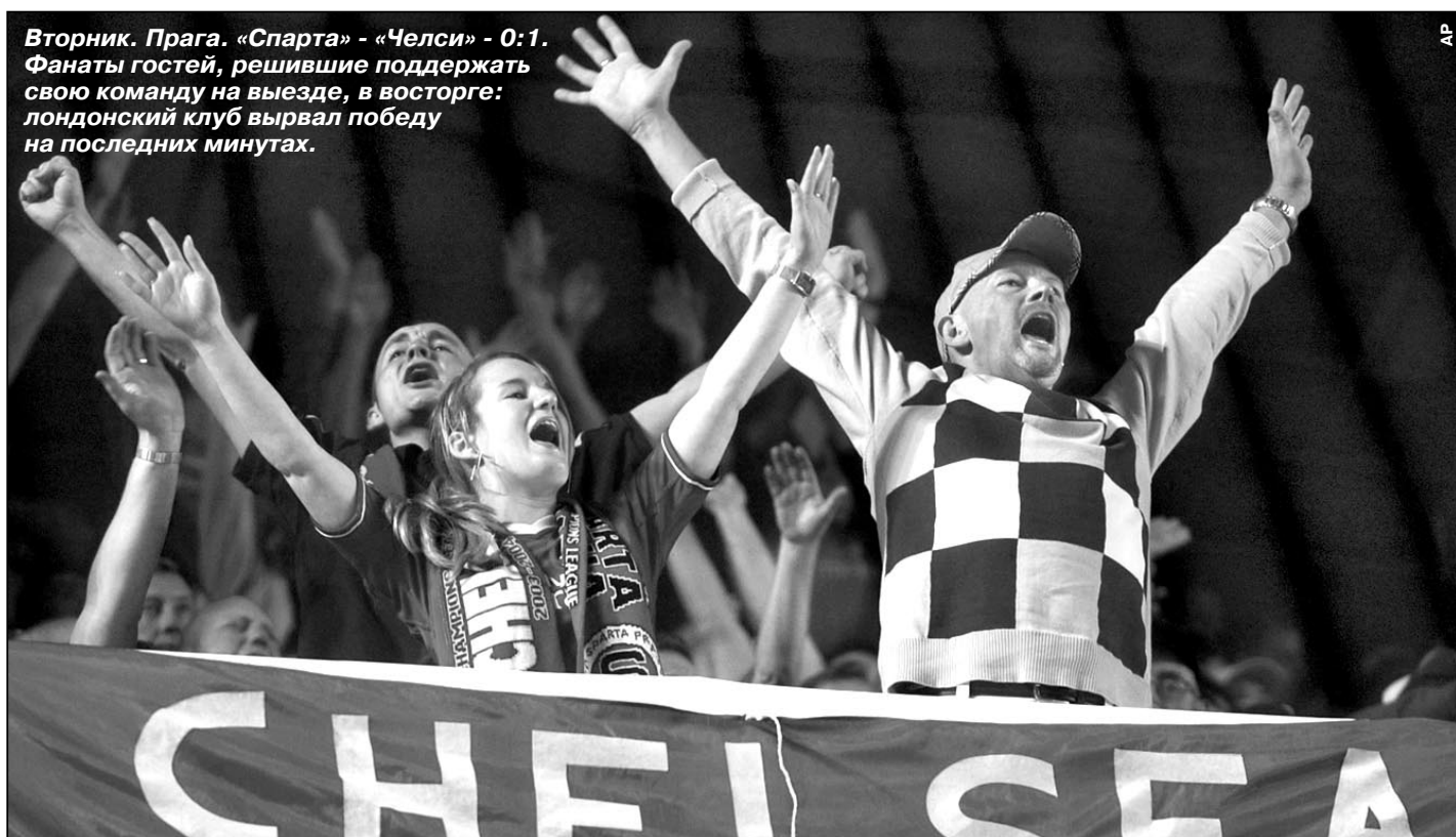
Вторник. Прага. «Спарта» - «Челси» - 0:1. Фанаты гостей, решившие поддержать свою команду на выезде, в восторге: лондонский клуб вырвал победу на последних минутах.

Европейский футбольный цирк под названием «Лига чемпионов» начал свои осенние гастроли. Вот звезды его программы: 5 голов в Манчестере, 6 - в Мадриде, победы гостей в Праге и Стамбуле, неуступчивость белградского «Партизана» в матче с обладателем Кубка УЕФА «Порту»! При этом единственным россиянином, который может себя считать полноправным участником событий вторника, стал владелец «Челси» Роман Абрамович. А вот трое игроков сборной России - нападающий Дмитрий Сычев из «Марселя», полузащитники Александр Мостовой из «Сельты» и Дмитрий Аленичев из «Порту» на поле позавчера не вышли.