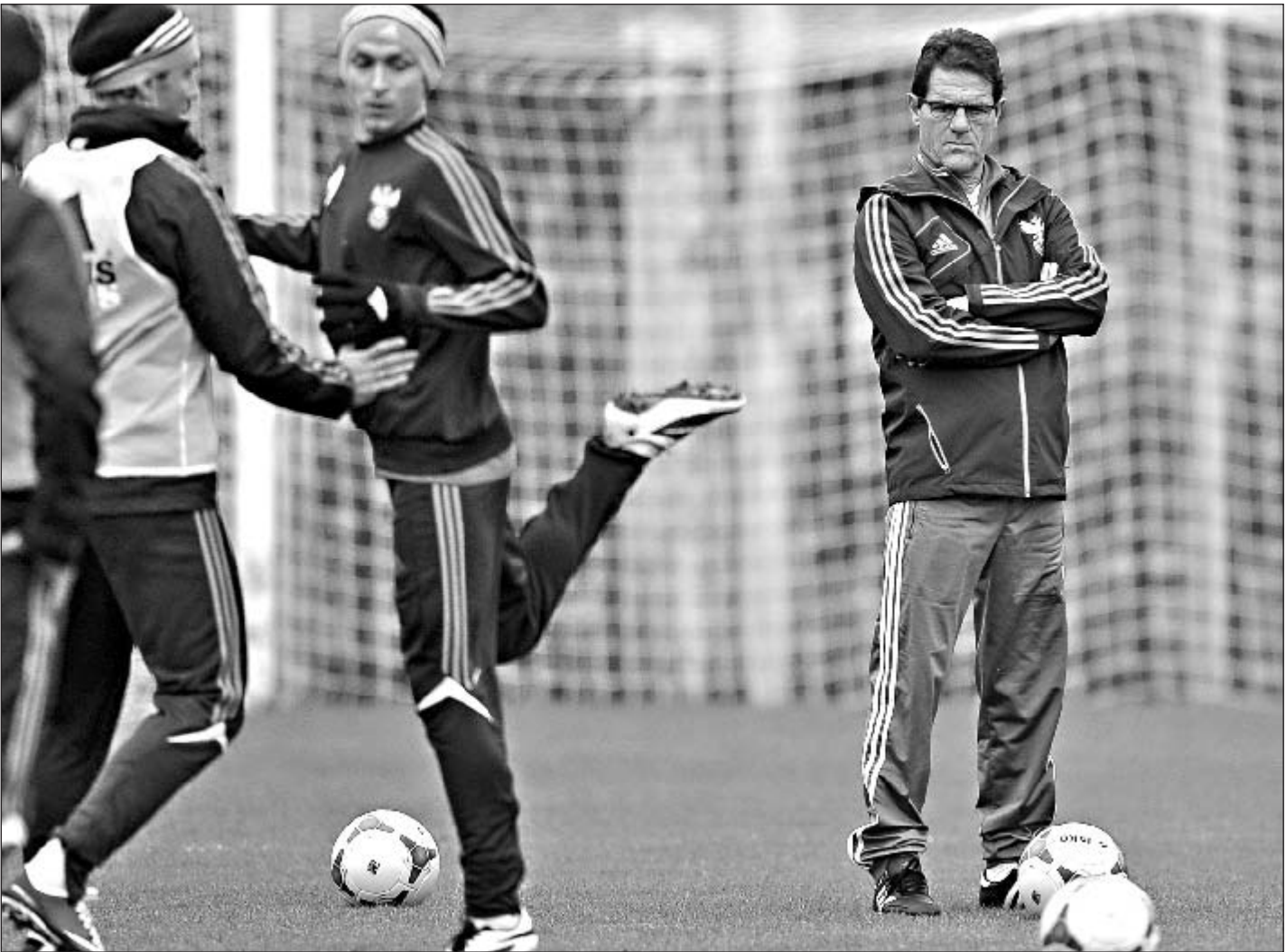
Вчера. Москва. Стадион им. Э.Стрельцова. Тренировка сборной России. Фабио КАПЕЛЛО уверен, что эти парни справятся.

Как известно, от Европы в Бразилию поедут 13 из 53 сборных, участвующих в отборочном турнире: 9 победителей групп (иных уже досрочно стали командами Голландии и Италии), а также 4 лучшие, определяемые в стыковых встречах. В стыки попадают 8 из 9 победных, занявших вторые места. Вторая сборная из «российской» группы точно получит право продолжить борьбу за путевку на чемпионат мира. Компанию ей, вероятнее всего, составят хорваты, шведы, венгры (возможно,