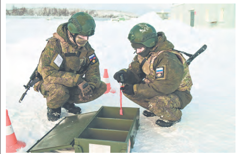
Учебные гранаты к занятию готовят заблаговременно.

Совсем недавно для этих ребят открылась новая страница их книги жизни. Казалось бы, ещё вчера на торжественных проводах говорилось о том, что юности одномоментно превратились в защитников Отечества, родного края, своих близких и родных. Дома в кругу родителей, любимых и друзей звучали добрые пожелания, слова напутствия. И вот она - военная служба - главный этап взросления и становления характера молодого человека, формирования его приоритетов и убеждений.