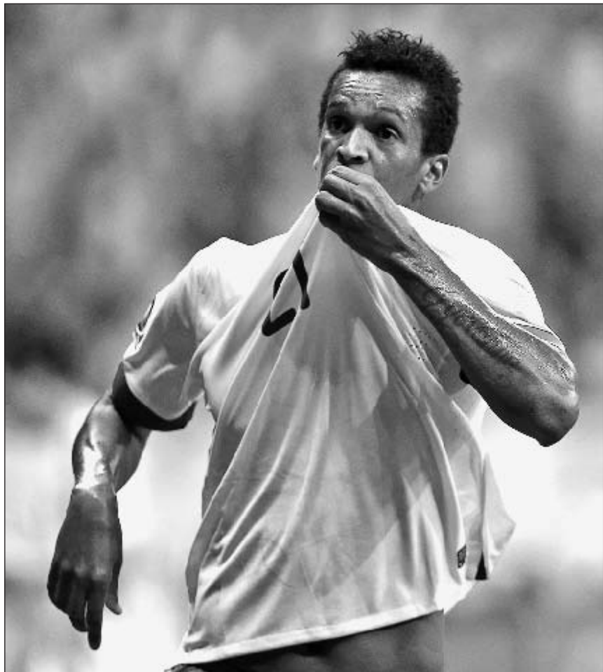
Суббота. Бразилия. Бразилия - Япония - 3:0. 90+3-я минута. Только что ЖО забил третий гол.