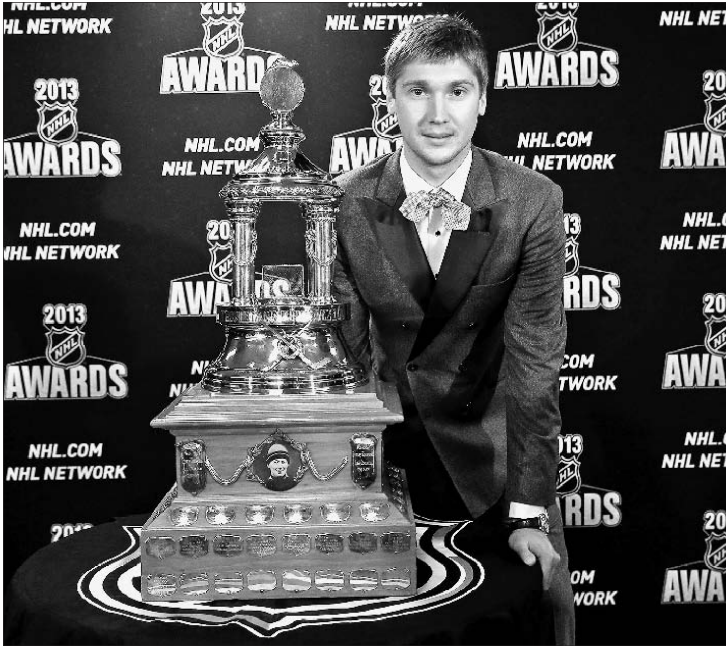
Вчера. Чикаго. Сергей БОБРОВСКИЙ и его «Везина Трофи».

В ночь с субботы на воскресенье в Чикаго состоялась церемония вручения индивидуальных призов регулярного сезона НХЛ. Впервые в истории трофеем лучшего голкипера лиги - «Везина Трофи» - завоевал российский вратарь Сергей Бобровский из «Коламбуса». Тогда как снайпер «Вашингтона» Александр Овечкин в третий раз в карьере получил приз самому ценному игроку турнира - «Харт Трофи».