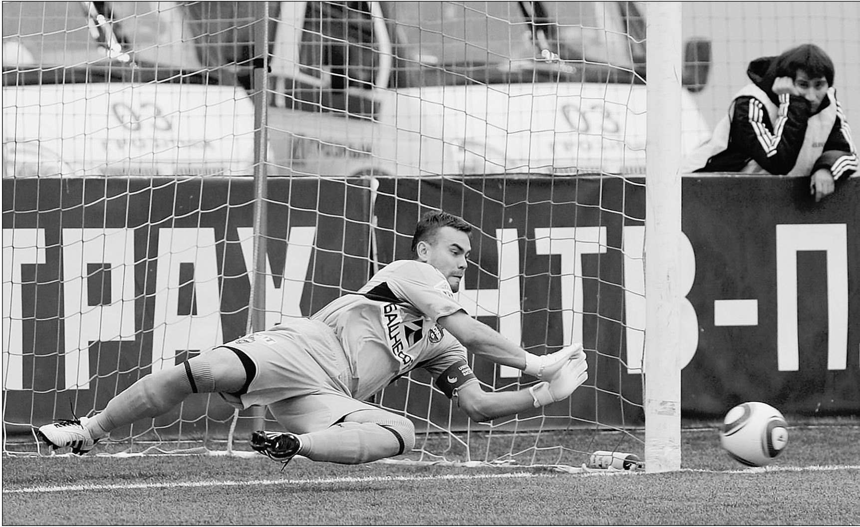
Вчера. Грозный. «Терек» - ЦСКА - 0:3. Может, блестяще отраженный Игорем АКИНФЕЕВЫМ пенальти заставит задуматься тех, кто готов поверить в любую спекуляцию на тему «договорняков»?

И чтобы быть понятым правильно и до конца: ваш корреспондент ни в коей мере не идеалист, считающий, что все у нас в футболе честно и чисто. Грязь, конечно же, надо чистить - тщательно, даже с ожесточением. Но это ведь тоже лучше делать на солнце, а не в зарослях.